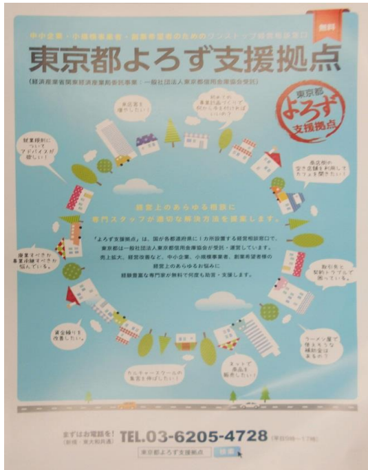
東京都よろず支援拠点のリーフレット