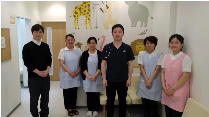
氷川台スタッフの皆さま