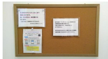
1F掲示板で情報を掲示