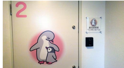
2Fは病児保育室『ペンギンルーム』