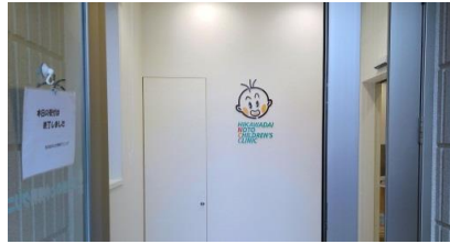
入口も親しみやすいロゴです