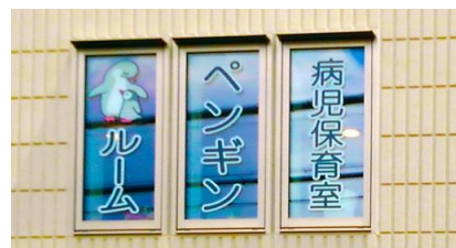
2F外からもわかりやすく