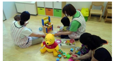
2F温かい保育が伝わります