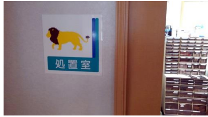
部屋のご案内も温かい