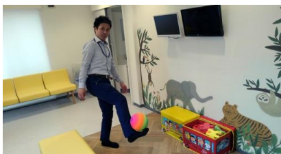
3F待合スペースも飽きません