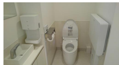
3F子どもにも使いやすいトイレ

インタビューー: オープンして間もない取材であったこともあり、新築の香りが立ち込めておりました。そして、快適な空間演出がされていて、病気でつらい状態が少しでも早く治るような気がします。氷川台のと小児科クリニックの取材は以上でございます。ご協力ありがとうございました。次は、平和台のと小児科クリニックを取材します。