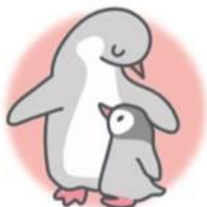
こちらは「病児保育室ペンギンルーム」のロゴです(親しみやすい)