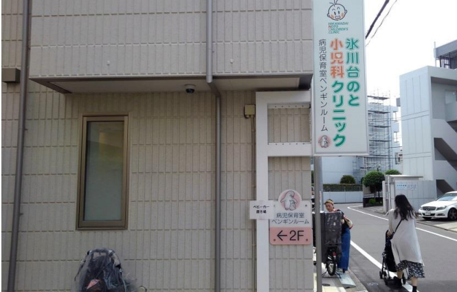
氷川台駅徒歩1分の場所にオープンしましたよお～

A4. さらに育児支援を行いたい と考え、 病児保育室併設型のクリニック を4月1日より開業いたしました。