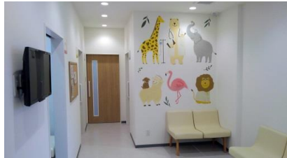
1Fはお子様安心してできるデザインです