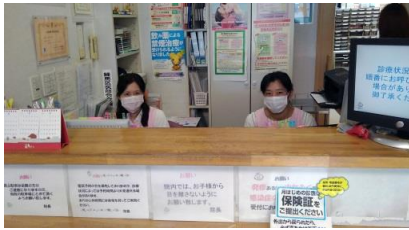
地域の皆が安心の受付