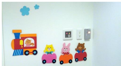
2F壁にも楽しめる工夫が