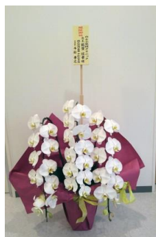
開院おめでとうございます