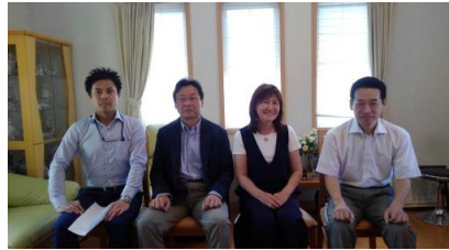
院長先生ご夫婦とパシヤリ