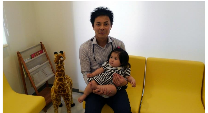
津村井係長にすっかり懐いて??おります