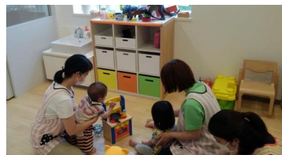
2F温かみ伝わる保育です