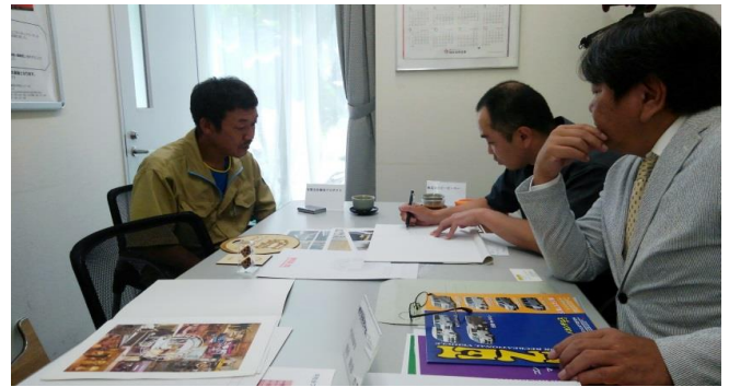
お次に会社のご紹介