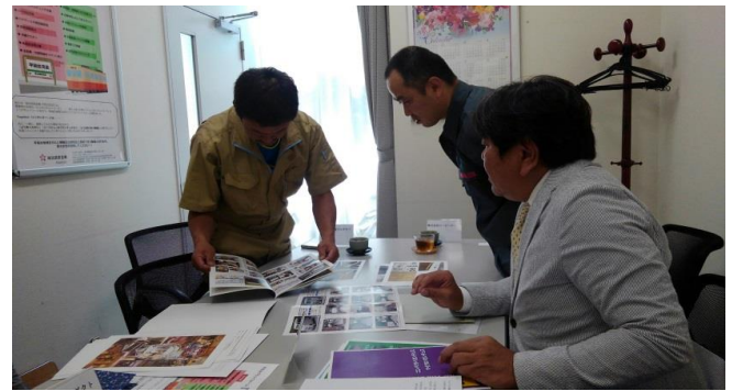
工場長同士でハイレベルな打合せ