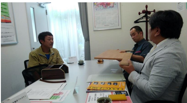
(有)輪栄プロダクトさまのサンプルをもとに打合せ