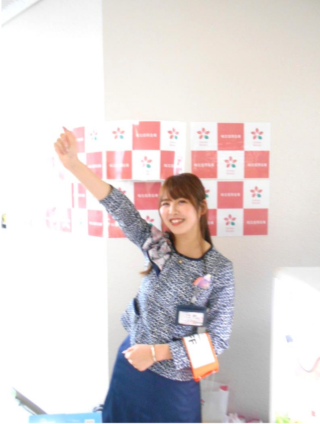
やる気満々のカスタマーG職員

令和一年十月十一日(金曜日)午後一時より、平和台体育館2F会議室にて、「住み慣れた地域で暮らし続けたい思いを支えたい」をテーマに、介護について紹介するイベントを練馬区第2地区事業所地域連絡会主催のもと開催しました。そのイベントに初めてコラボ参加しました。