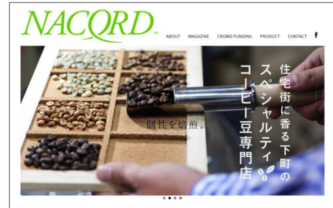
▲ NACORD（ナコード） http://www.nacord.com/

「NACORD」を異なる地域のお客さま同士を結びつける場としても活用いただけるよう、全国の信用金庫との連携を進めており、平成30年度末現在、当金庫を含めた10金庫が連携しています。