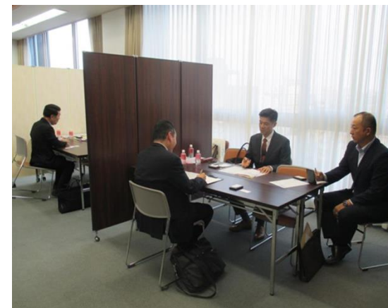
▲ 「第6回 城北 新現役交流会」の開催

平成30年 10月18日、地元中小企業の経営課題の解決を支援する取り組みとして、「第6回 城北 新現役交流会」を開催しました。この交流会は、豊富な知識や経験、ネットワークを有する新現役（おおむね50歳以上で、一つの分野で10年以上の職歴を持ち、それを活かした中小企業支援に意欲のある人材）の方と、地元中小企業の出会いの場を提供するもので、お取引先企業30社と新現役97名の間で、のべ140件の面談が行われました。