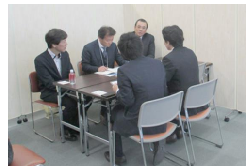
▲「第7回 城北 夢をかなえる商談会」の開催

今回は77社の企業が参加し、両日で工業系42件、非工業系で74件の商談が行われ、参加企業からは「すぐ取引したい企業とも会うことができ、今回初めて参加したが、今後も継続して参加したい」など、積極的な意見を頂いています。