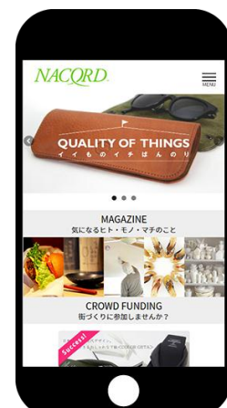
▲トップページ例（左：パソコン版、右：モバイル版）