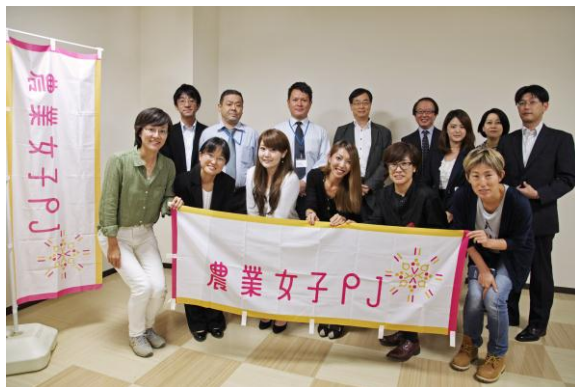
参加農業女子 PJ メンバー（前列 6 名）による記念撮影