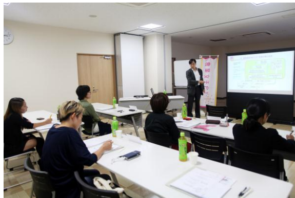
専門家による講演